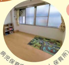
病児保育室 (なかよし保育所)