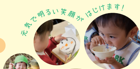
元気で明るい笑顔がはじけます!

子どもたちの主体的な遊びをサポートしながら、家庭的な雰囲気の中でゆっくりとした保育を行っています。給食・おやつは手作りのものをご提供しています。