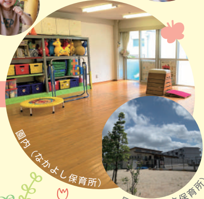
園内 (なかよし保育所)

当院では職員の皆さまが安心して子育てと仕事を両立できる環境をつくる為に院内保育所を設置しております。お父さん・お母さんが安心して働けるようにサポートします。