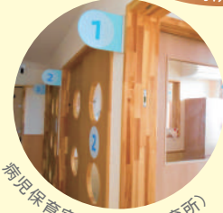
病児保育室 (つばさ保育所)