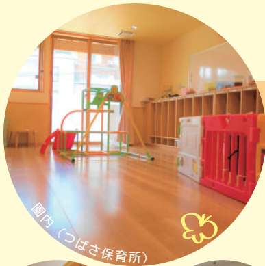
園内 (つばさ保育所)