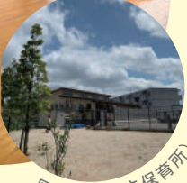
園庭 (つばさ保育所)