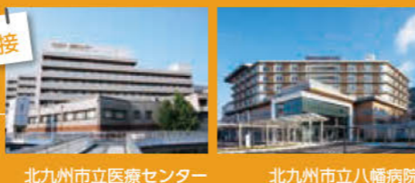
北九州市立医療センター 北九州市立八幡病院