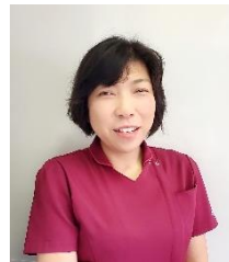
がん看護専門看護師／ がん性疼痛看護認定看護師