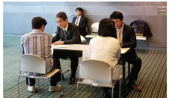
当院主催の市民公開講座では、来場者とお話させていただく「病気に関する相談コーナー」を設置しました